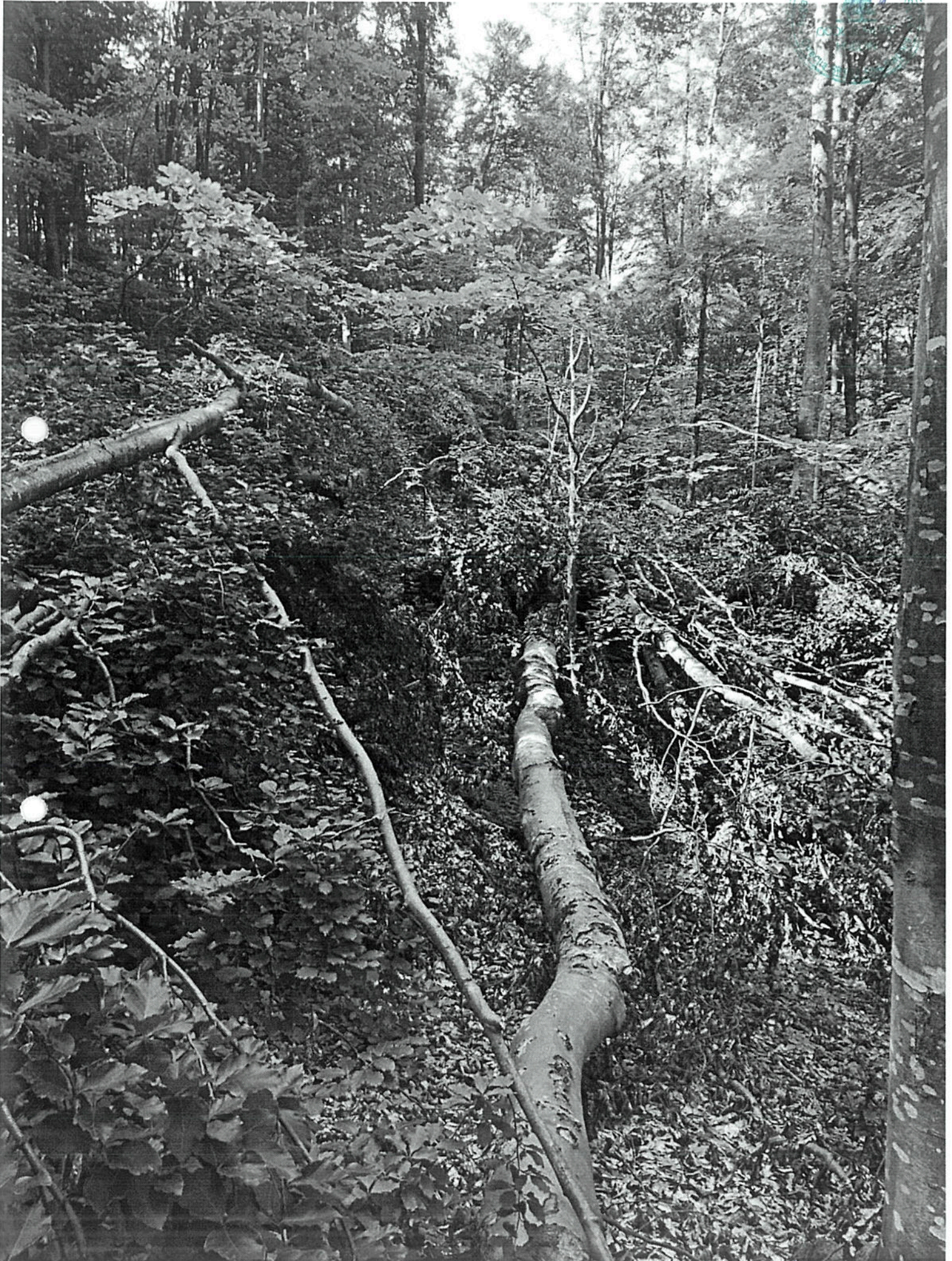
O.S. Huedin / U.P. Comp. Pnă / m. 2441. / A.E. / 55 mc / 05.07.2017